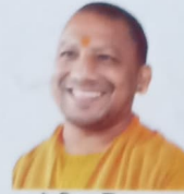
योगी आदित्यनाथ मुख्यमंत्री उत्तर प्रदेश

समाज कल्याण विभाग, उत्तर प्रदेश DEPARTMENT OF SOCIAL WELFARE UTTAR PRADESH